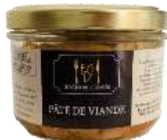
Pâté de Viande 180g - 008992