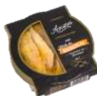
Maquereaux au Piment de Jamaïque à l'huile d'olive 130g - 002855