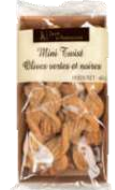
Mini twist Olives Vertes et Noires 60g - 002861