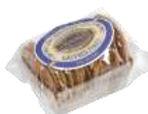
Gaufres fines au beurre 150g - 002794