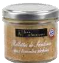
Rillettes de Sardines aux Tomates Séchées 90g - 001774