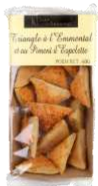
Triangles à l'Emmental et au Piment D'Espelette 60g - 002053