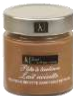
Lait noisette 200g - 000451