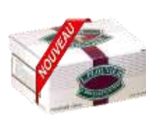
Pol Ploum au rhum 240g - 002810