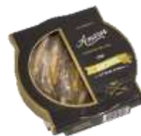
Anchois à l'huile d'olive 130g - 002857