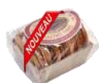
Gaufres fines au rhum 150g - 002795