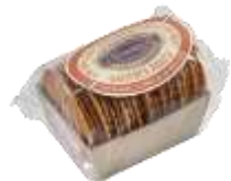
Gaufres fines au caramel beurre salé 150g - 002796