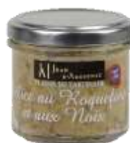
Délice au Roquefort et aux Noix 100g - 001340