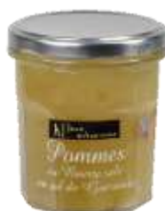
Pommes au beurre Salé 001273