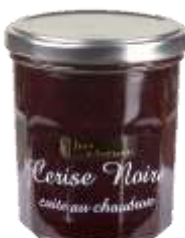
Cerise Noire 008239