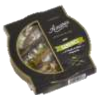
Sardines piquantes à l'huile d'olive 130g - 002854