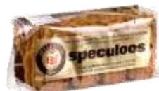
Speculoos 225g - 006797