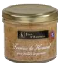
Terrine de Homard aux Petits Légumes 90g - 006606