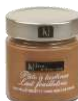
Lait feuilletine 200g - 000834