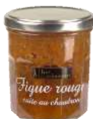
Figue Rouge 008232