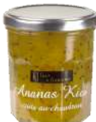
Ananas Kiwi 008242