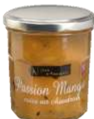
Passion Mangue 001012