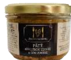
Pâté au Citron confit et Gingembre 180g - 009074