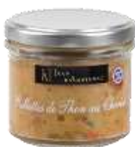
Rillettes de Thon au Chorizo 90g - 001775