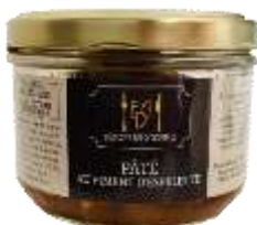
Pâté au Piment D'Espelette 180g - 009067