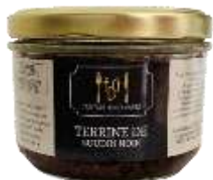
Terrine de Boudin Noir 180g - 009036