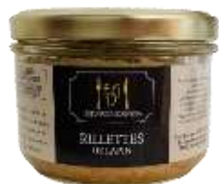
Rillettes de Lapin 180g - 008978