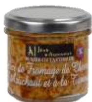
Délice de Fromage de Chèvre à l'Artichaut et à la Tomate 100g - 001341