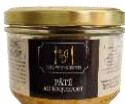
Pâté au Roquefort 180g - 009081