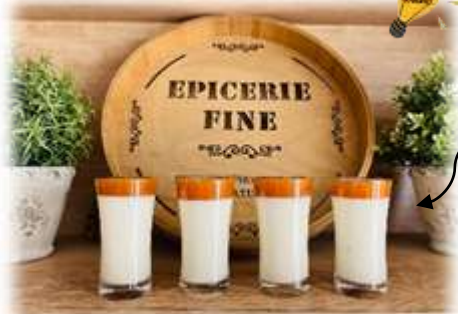
Panna Cotta et son coulis d'Abricot !