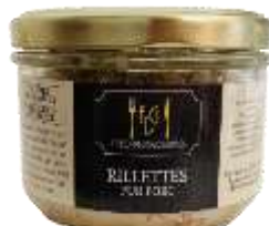
Rillettes pur Porc 180g - 008954