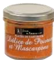
Délice de Poivron et Mascarpone 90g - 002198