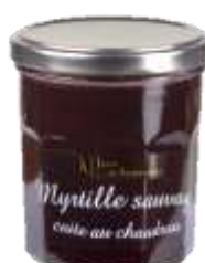
Myrtille Sauvage 008235