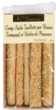
Longs sticks Emmental et Herbes de Provence 80g - 002209