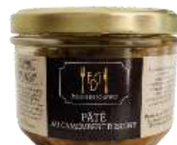
Pâté au Camembert d'Isigny 180g - 009043