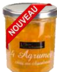
4 Agrumes 008230