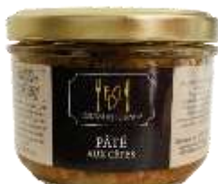
Pâté aux Cèpes 180g - 009098