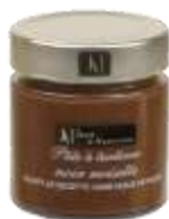
Noir noisette 200g - 000452