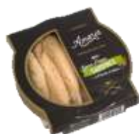
Sardines sans peau à l'huile d'olive 130g - 002853