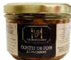
Confit de Foie à l'ancienne 180g - 009012