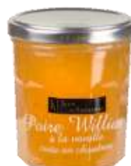
Poire William à la Vanille 008236