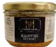
Rillettes de Poulet 180g - 008985