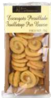
Escargots Persillade pur beurre 75g - 002052