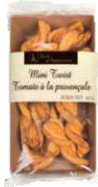
Mini twist tomate à la Provençale 60g - 002860