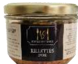
Rillettes d'Oie 180g - 008961