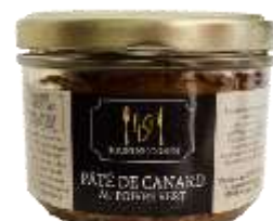
Pâté de Canard au Poivre Vert 180g - 009005