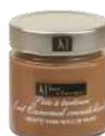
Lait caramel croustillant 200g - 002264