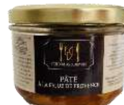
Pâté à la Figue de Provence 180g - 009050