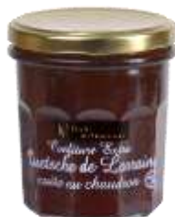
Quetsche de Lorraine 002734