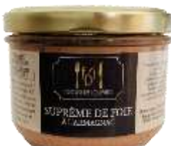
Suprême de Foie à l'Armagnac 180g - 009029