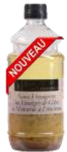
Vinaigre de Cidre et Moutarde à l'ancienne 50cl - 008210